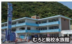
むろと麩校水族館